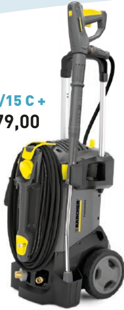
HD 5/15 C + € 679,00