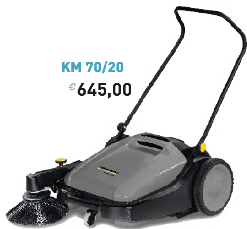
KM 70/20 € 645,00