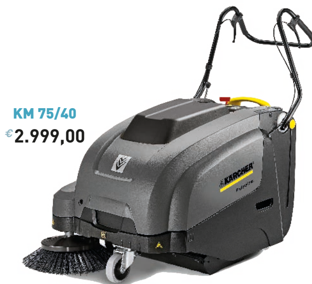
KM 75/40 € 2.999,00