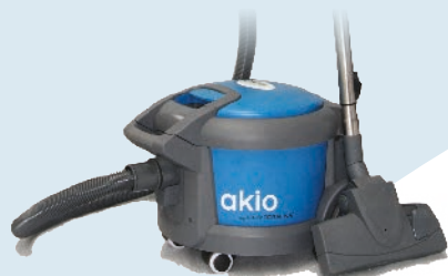
S 10 € 185,00