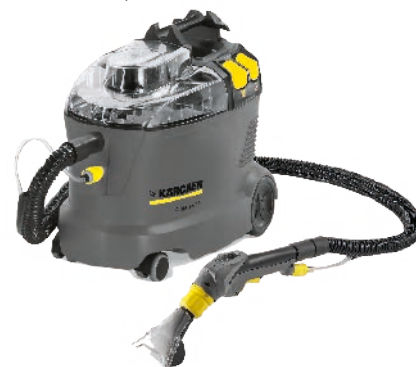
PUZZI 8/1 € 514,00