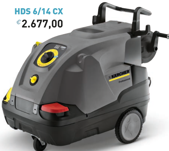
HDS 6/14 CX € 2.677,00