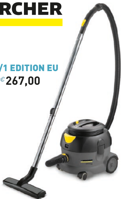
T 12/1 EDITION EU € 267,00