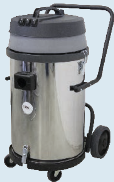
SW 80/3 M B € 485,00