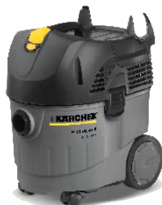
NT 35/1 AP € 324,00