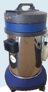
EX 40 M € 335,00