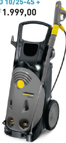
HD 10/25-4S + € 1.999,00