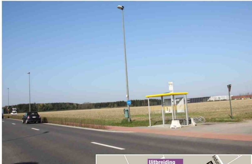
Er wordt nog onderzocht hoe de verkeersafwikkeling moet gebeuren. Onder meer aan de rotondes op de N76 (foto onder).