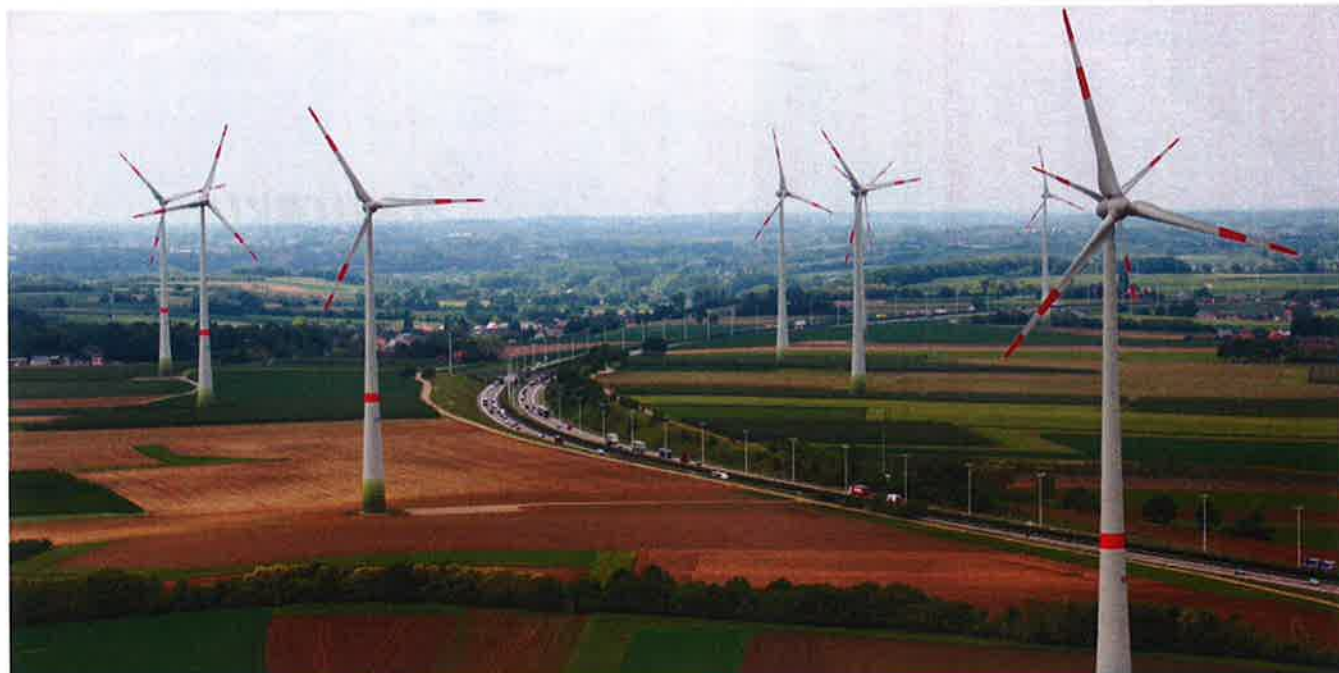
Windpark Halen - Diest - Bekkevoort

Met onze windenergieprojecten bouwen wij aan een klimaatneutraal Limburg.