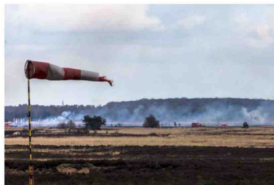
De militaire domeinen van Leopoldsburg tellen mee in het ruimtebeslag, maar dragen ook bij tot het groene karakter van Limburg.

ruimtebeslag, om het Limburgs DNA te vrijwaren. “Het groene karakter van onze provincie is onze troef bij uitstek. We moeten inzetten op betere verbindingen, in combinatie met slimme inbreidingen (bouwen binnen bestaande bebouwing, in tegenstelling tot uitbreiding, red.) van onze steden en gemeenten.”