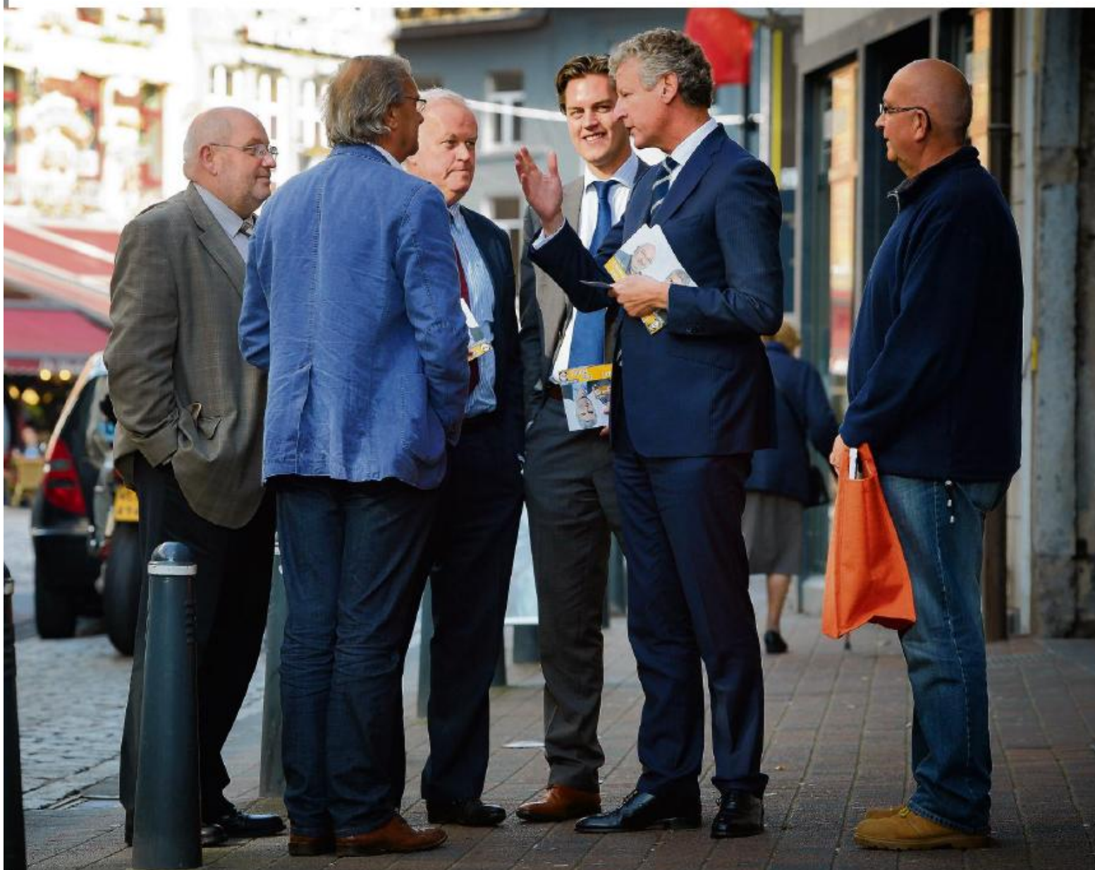
Pieter De Crem langs Hasseltse wegen: 'Ik kom naar hier uit sympathie. En bovendien, ik voer graag campagne.'

verwacht je niet onmiddellijk in Hasselt. Maar zo leren we elkaar eens kennen. Al weet ik nog steeds niet op wie ik ga stemmen. Dat De Crem hier rondloopt, heeft daar nog niets aan veranderd.' Ondertussen baant het groepje politici zich een weg naar de Ha-