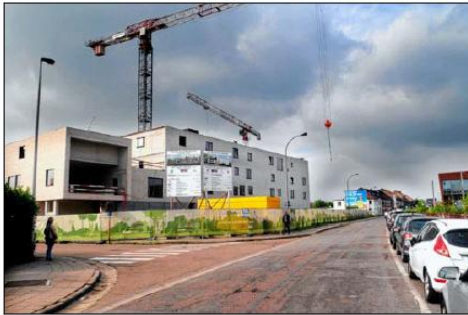
De Spoorwegstraat wordt ter hoogte van het City Hostel doorgesneden.