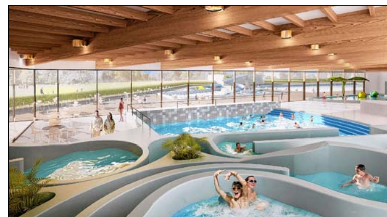
In het zwembad zijn ook nog een golfslagbad, een kinderbad en een wildwaterbaan gepland.

kinderploeterbad en een wildwaterbaan", gaat Van Zeebroek verder. "Verder is er horeca met terras, een vergaderzaal, 40 individuele kleedkamers en 32 groepskleedkamers. Buiten behouden we het 50-meter