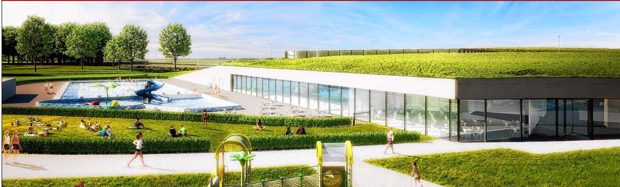
Zo moet de nieuwe zwembadsite in de Elfde Liniestraat er in 2016 uitzien. Rechts het nieuwe binnenbad met groendak. Links het bestaande buitenbad.