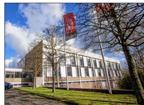
Het oude zwembad gaat tegen de grond nadat het nieuwe klaar is.