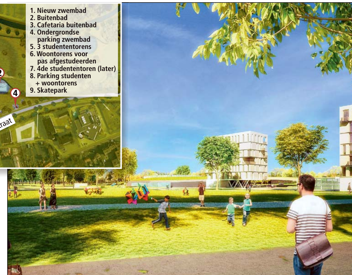
De studentencampus van de Elfde Liniestraat moet veel groen bevatten. Achteraan kan je het nieuwe zwembad zien en twee van de drie studententorens.