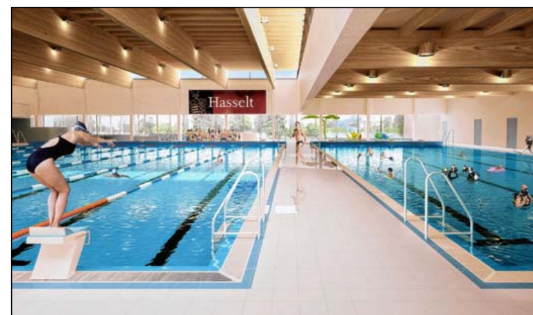
De binnenkant van het toekomstige bad. Met links het 25-meterbad met acht banen en rechts het 25-meterbad van 4 banen.

"Naast de beide 25-meter baden komt er ook nog een instructiebad dat ook een golfslagbad is, een