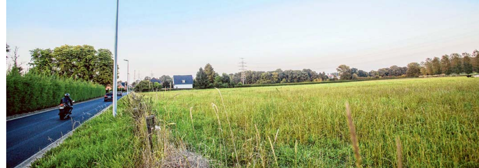
Er is een milieuvergunningaanvraag voor drie windmolens in de Pietelbeekstraat. De stad gaf negatief advies.