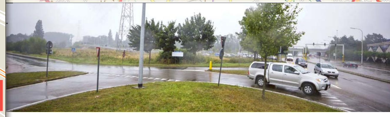
Het begin van de Biezenstraat tegenover garage Billen op de Sint-Truidersteenweg.