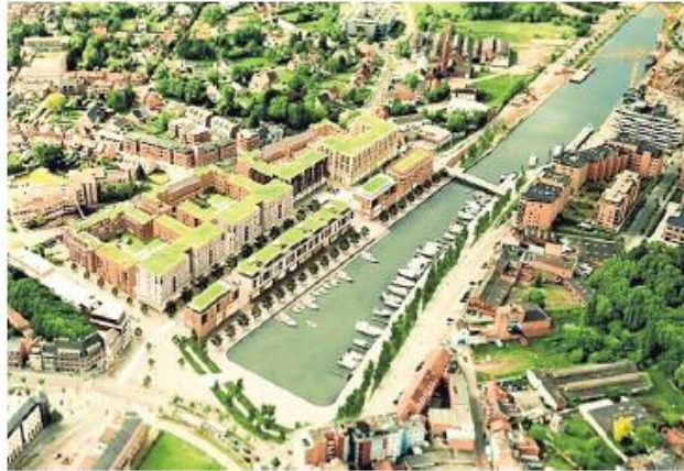
Een toekomstbeeld van de Blauwe Boulevard. Binnen drie jaar moet de westerszijde ervan helemaal ontwikkeld zijn.

Tegen het project - dat maar liefst 20.000 vierkante meter winkelruimte, 2.500 vierkante meter horeca, 2.500 parkeerplaatsen en 400 woningen omvat - liepen de voorbije maanden verschillende procedures. Vastgoedontwikkelaar Redevco liet zijn bezwaren eind vorig jaar al vallen en nu blijkt dat ook de Hasseltse hore-