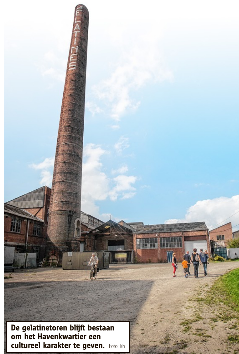
De gelatinetoren blijft bestaan om het Havenkwartier een cultureel karakter te geven.