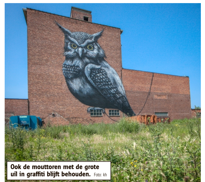
Ook de mouttoren met de grote uil in graffiti blijft behouden.