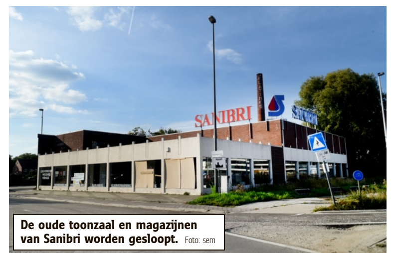
De oude toonzaal en magazijnen van Sanibri worden gesloopt.