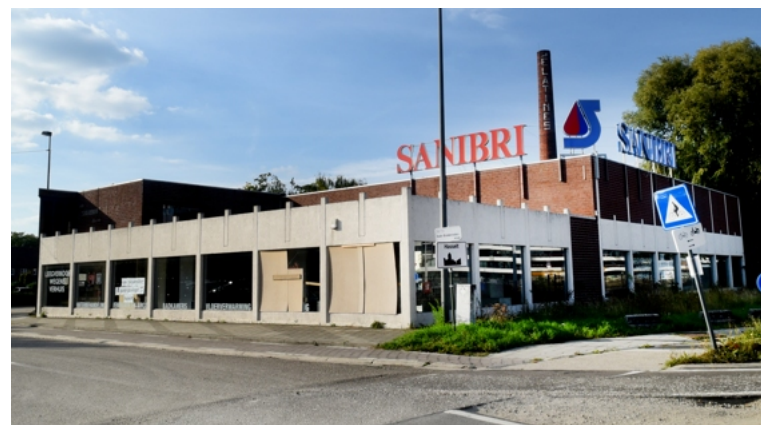
Het gebouw van Sanibri en drie werkmanshuisjes gaan tegen de vlakte.