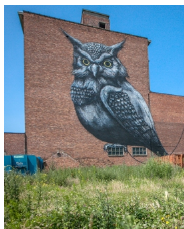
De mouttoren met de uil van ROA.