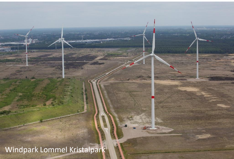
Windpark Lommel Kristalpark