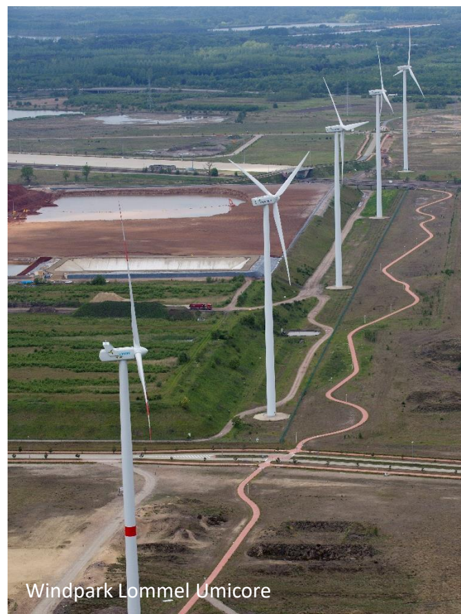
Windpark Lommel Umicore